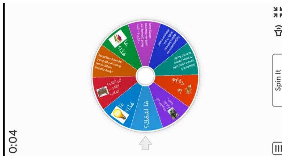
Gambar 4. 2 Tampilan Desain Soal

Tahap selanjutnya adalah uji coba lapangan yang dilakukan pada seluruh siswa kelas V. Pada tahap ini, media digunakan dalam proses pembelajaran secara langsung untuk mengetahui efektivitasnya dalam meningkatkan kemampuan berbicara siswa. Selama proses pembelajaran, siswa menunjukkan peningkatan keaktifan dan partisipasi dalam kegiatan berbicara. Pada tahapan akhir, peneliti melakukan evaluasi secara menyeluruh terhadap produk yang telah dikembangkan melalui analisis terhadap data-data yang diperoleh dari hasil implementasi lapangan dan melakukan penilaian terkait dengan pengembangan media game edukasi.